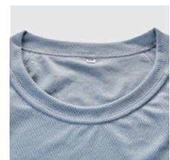
T-Shirt aus HT-REC