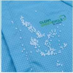
Polyesterfaser hergestellt aus PET-Chips