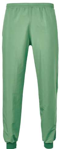
Pullover und Hose aus Light-Tech REC

Unsere nachhaltigen reinraumtauglichen Textilien DASTAT-REC , Light-Tech REC und HT-REC werden zu 100 % aus recycelten PET-Flaschen hergestellt. Umfangreiche Studien und Tests an unabhängigen international anerkannten Textilforschungsinstituten belegen, dass DASTAT-REC kombiniert mit Light-Tech REC oder HT-REC die Anforderungen von kritischen Prozessen in Reinräumen erfüllen. Bei den Untersuchungen wurde – wie bei allen von Dastex eingesetzten Textilien – besonderer Wert darauf gelegt, dass alterungsbedingte Effekte mitberücksichtigt werden.